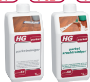
HG P54 HG P55