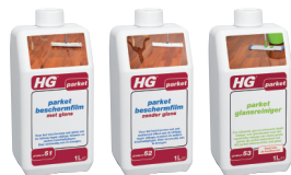
HG P51 HG P52 HG P53